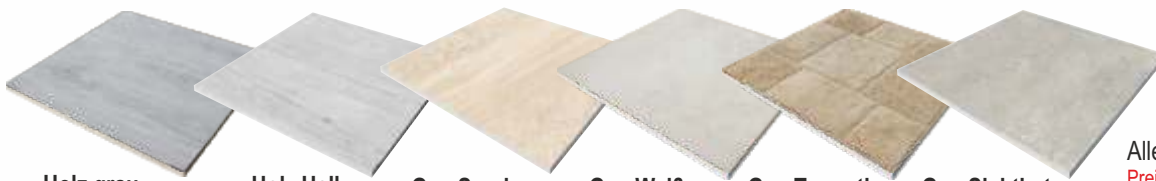
Holz grau Holz Hell Geo Sand Geo Weiß Geo Travertin Geo Sichtbeton

rektifiziert, R10 statt m 2 € 67,65 mit Preisbremse per m 2 nur € 49,50