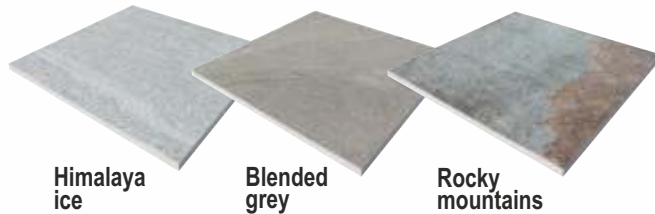
Himalaya ice Blended grey Rocky mountains

Alle Farben per m 2 € 67,65 Preise gelten für aktuelle Lagerware.