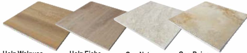
Holz Walnuss Holz Eiche Geo Natur Geo Beige

rektifiziert, R10 statt m 2 € 67,65 mit Preisbremse per m 2 nur € 49,50