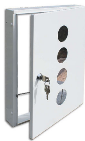
Entnahmetür in RAL-Farbe 9010 mit Sichtfenster