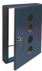
Entnahmetür in RAL-Farbe 7016 mit Sichtfenster

Die Entnahmetür ist in zwei Varianten lieferbar: Wählen Sie die preiswerte Variante aus verzinktem Stahlblech oder die zusätzlich in RAL-Farbe pulverbeschichtete Ausführung.