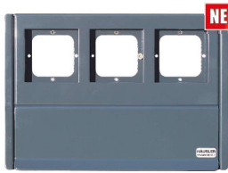
Anthrazit RAL 7016

Modernes, glattes Design. Extragroße Einwurfklappe, mit Entnahmesicherung, pulverbeschichtetes Edelstahl mit vorgestanzten Öffnungen für die Aufnahme der GIRA Module inkl. Befestigungshalterungen. Die Montage der Frontplatte erfolgt einfach in der vorderen Öffnung des Durchwurfskastens