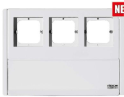
Reinweiß RAL 9010