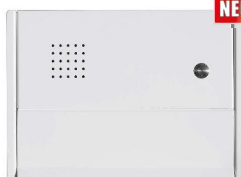
Reinweiß RAL 9010