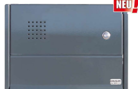
Anthrazit RAL 7016

Modernes, glattes Design. Extragroße Einwurflappe, mit Entnahmesicherung, pulverbeschichtetes Edelstahl mit gelochtem Sprechfeld und Edelstahl-Klingeltaster. Die Montage der Frontplatte erfolgt einfach in der vorderen Öffnung des Durchwurfkastens