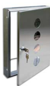
Entnahmetür in Nirosta „Edelstahl“ mit Sichtfenster

Die Entnahmetür ist in drei Varianten lieferbar: Wählen Sie die preiswerte Variante aus verzinktem Stahlblech, die Edelstahl-Variante oder die zusätzlich in RAL-Farbe pulverbeschichtete Ausführung.