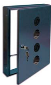
Entnahmetür in RAL-Farbe 7016 mit Sichtfenster