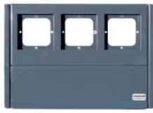
Anthrazit RAL 7016

Modernes, glattes Design. Extragroße Einwurfklappe, mit Entnahmesicherung, pulverbeschichtetes Edelstahl mit vorgestanzten Öffnungen für die Aufnahme der GIRA Module inkl. Befestigungshalterungen.