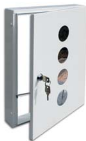
Entnahmetür in RAL-Farbe 9010 mit Sichtfenster