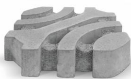
Kreativ Pflaster 4238