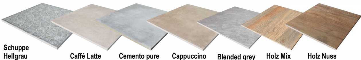
Schuppe Hellgrau Caffé Latte Cemento pure Cappuccino Blended grey Holz Mix Holz Nuss