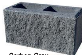
Carbon-Grau Bestpreis per lfm € 79,57*