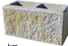
Jura Bestpreis per lfm € 79,57*