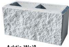
Arktis-Weiß Bestpreis per lfm € 79,57*