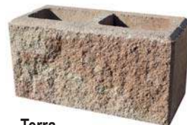
Terra Bestpreis per lfm € 79,57*