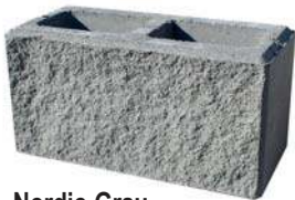
Nordic-Grau Bestpreis per lfm € 71,02*