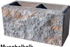
Muschelkalk Bestpreis per lfm € 79,57*