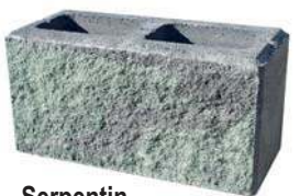
Serpentin Bestpreis per lfm € 79,57*