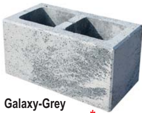
Galaxy-Grey Per lfm € 168,73*