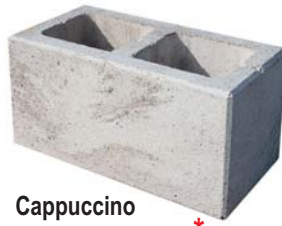
Cappuccino Per lfm € 168,73*