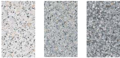
Naturweiß Granitgrau Dunkelgrau

Bestpreis für alle Farben per lfm € 59,95