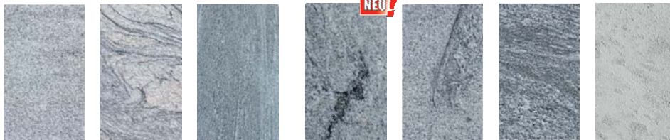
Granit Hellgrau Granit Coral Wave Läuft 2021 aus Granit Stripe Läuft 2021 aus Granit Coral Cloud NEU Granit Silver Cloud Granit Dark Cloud Kalkstein Rimini

Sichtkantenausführung 30 mm (+/- 10% in der Dicke sind in der Norm erlaubt)