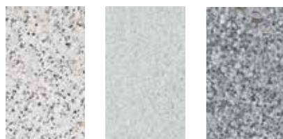
Naturweiß Granitgrau Dunkelgrau