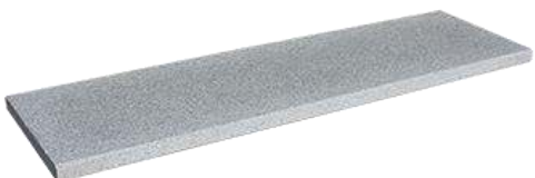
Granitgrau (ArtNr: 3229)