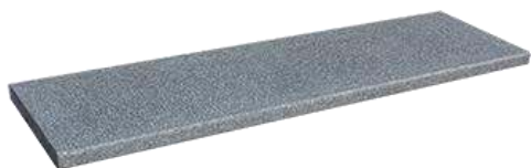
Dunkelgrau (ArtNr: 3232)