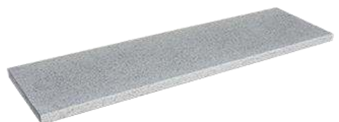
Naturweiß (ArtNr: 3230)