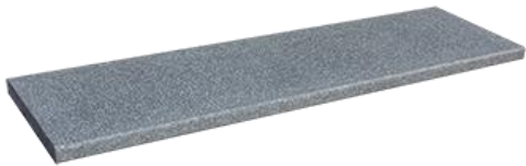
Dunkelgrau (ArtNr: 3232)