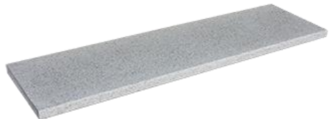
Naturweiß (ArtNr: 3230)