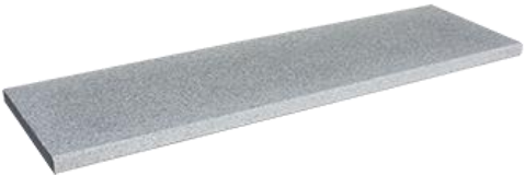
Granitgrau (ArtNr: 3229)