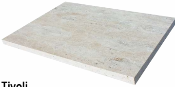
Tivoli statt € 117,60 per m 2 € 99,96

AKTIONSPREIS 0% 15 % Rabatt im Jahr 2022