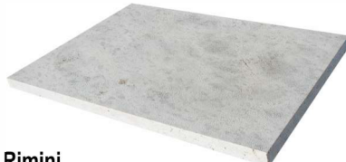
Rimini statt € 117,60 per m 2 € 99,96