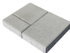
Grau natur 2469