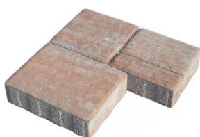
Old-style Colored 4236