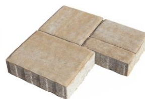
Old-style Sand 4235