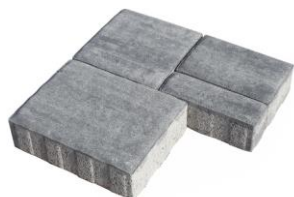
Old-style Grey 4237