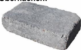
Silbergrau schattiert 2871