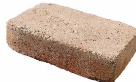
Lachsrot schattiert 4400