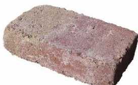
Herbstlaub schattiert 2874