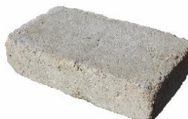
Beigegelb schattiert 2873