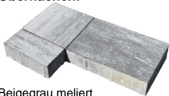
Beigegrau meliert 4617