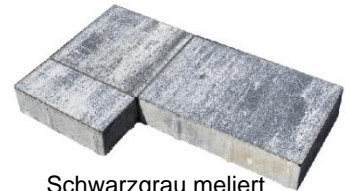
Schwarzgrau meliert 4620