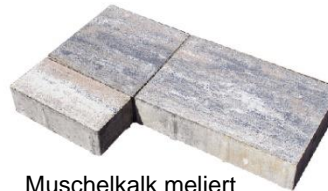
Muschelkalk meliert 4618