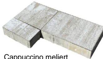
Cappuccino meliert 4619