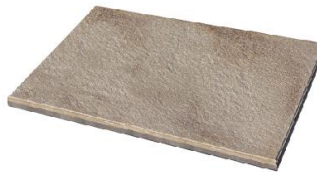
Terrabeige marmoriert 3937