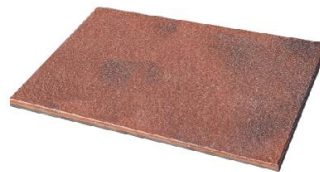
Rubinrot marmoriert 3935