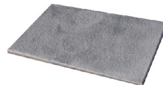
Silbergrau marmoriert 3936