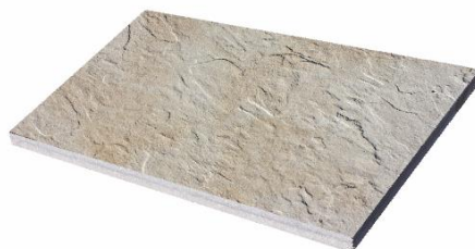
Beige marmoriert 3884