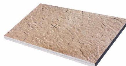
Braun marmoriert 3885