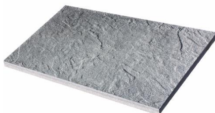
Grau marmoriert 3938