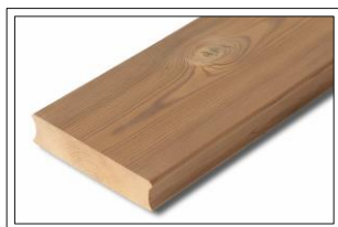
Thermo-Kiefer GLATT 3189